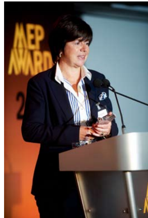
Frieda MEP van het jaar

In de vorige nieuwsbrief werd al vermeld dat Frieda genomineerd werd als MEP van het jaar in de categorie handel. Op 3 november sleepte Frieda de prijs daadwerkelijk in de wacht! Frieda werd geroemd om haar toonaangevende rol bij het invoeren van een Europees handelsverbod op zeehondenproducten. Tegen de stroom in, schreef zij als rapporteur in de Milieucommissie immers een opinie die de weg effende voor een volledig Europees handelsverbod. Ze was ook nauw betrokken bij de onderhandelingen voor een akkoord in eerste lezing met de Raad, nam deel aan talrijke manifestaties en organiseerde een aantal succesvolle informele ontmoetingen.